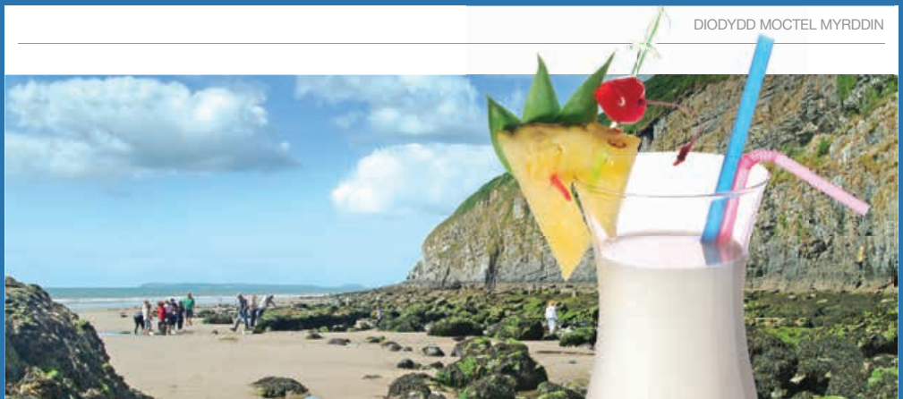
DIODYDD MOCTEL MYRDDIN

BYDD HI'N CYMRYD O LEIAF AWR I'CH CORFF GAEL GWARED AR BOB UNED O ALCOHOL. OS YDYCH CHI EISIAU BOD YN DDIOGEL AC OSGOI COLLFARN, BYDD Y DAFLN HON YN EICH HELPŪ CHI I GYFRIF YN FRAS PRYD FYDD EICH CORFF HEB ALCOHOL YNDDO.